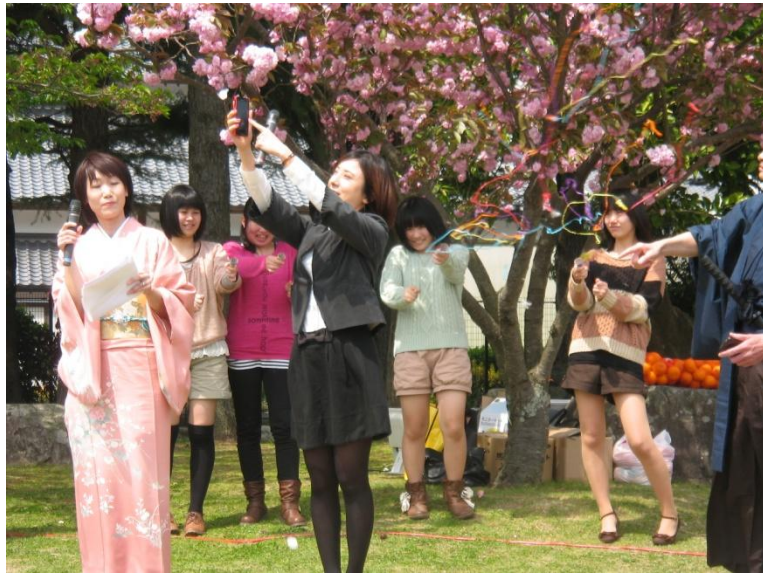
5、4、3、2、1のカウントダウンで開通ボタン！