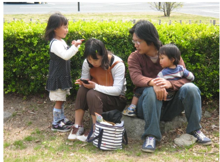
家族連れも一生懸命スマホを覗き込む