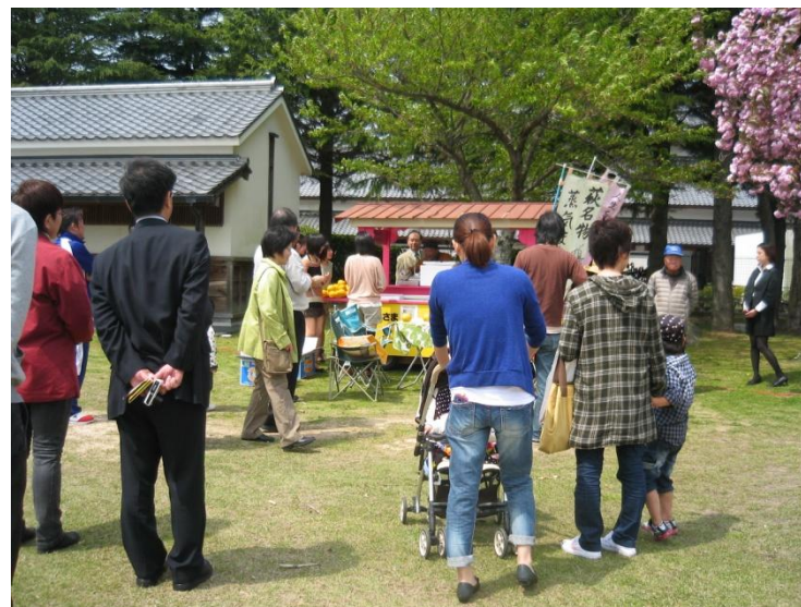
萩名物の夏みかんジュースや、蒸気饅頭も振舞われた