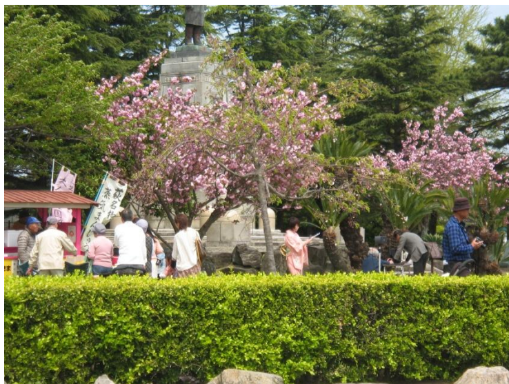
イベント開始を待つ素水園、萩博物館の前

2013年4月14日 萩市・素水園にて 主催：ITコーディネータやまぐち共同組合